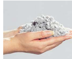
【セルローズファイバー】